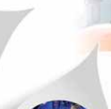
Bombole di Ossigeno e Acetilene per saldobrasatura