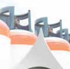
Bombole di gas Refrigerante per Frigoriferi e Condizionatori