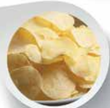
Bombole di Azoto per il confezionamento Alimentare

SEDE DI CORMANO - Via Giotto, 28 - Cormano (MI) - Tel. 02 663 05380 - Fax 02 663 07346