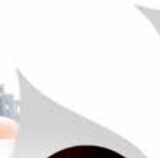
Bombole di Gpl per barbecue, camper, stufe