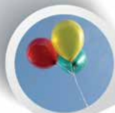
Bombole di Elio per palloncini