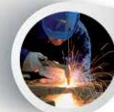
Bombole di Argon e Miscele per saldatura