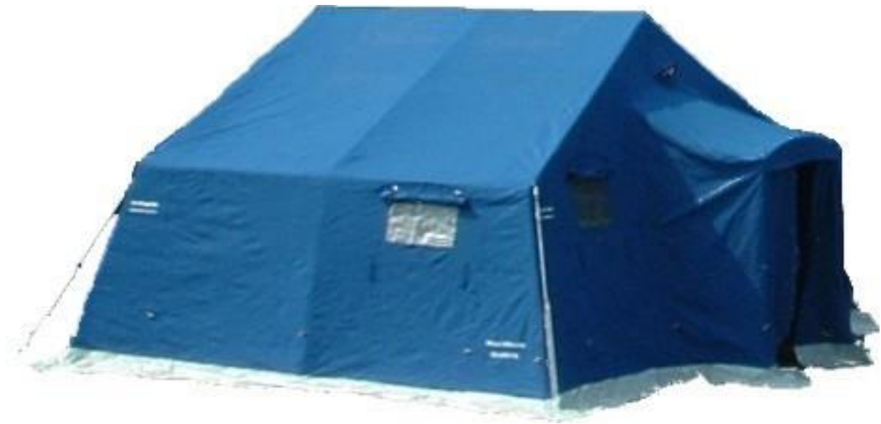
Tenda 6*5m tipo per campo profughi

Si tenga conto ai fini della individuazione che per una area da adibire a tendopoli che possa accogliere 500 persone secondo le indicazioni del Dipartimento della Protezione Civile, lo spazio utile deve essere pari ad almeno mq. 6000 , senza contare l'area necessaria per l'afflusso ed il posizionamento delle colonne di soccorso, che si ritiene debba essere attigua o quanto meno sufficientemente vicina e ben collegata alla tendopoli.