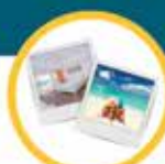
VIAGGI ALLE MALDIVE per 2 persone ALL-INCLUSIVE